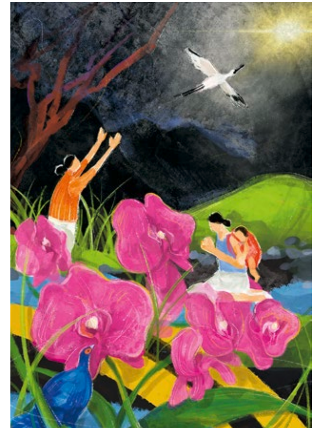
Bild zum Weltgebetstag 2023 mit dem Titel "I Have Heard About Your Faith" von der taiwanischen Künstlerin Hui-Wen Hsiao.

🕒 Freitag, 3. März 19.00 Uhr Gemeindesaal Zehren 19.30 Uhr Gemeindesaal Lommatzsch.